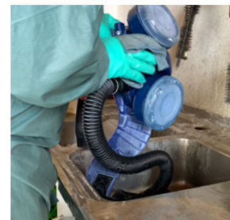
Die Aussenseite der PSA wird immer mit Handschuhen angefasst ...