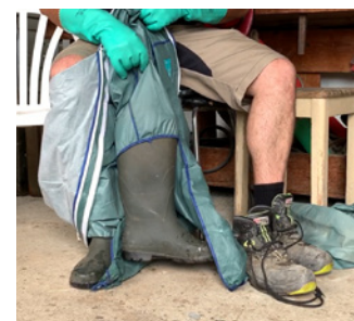
... gleichzeitig vermeiden wir, die Innenseite der Kleidung zu berühren.