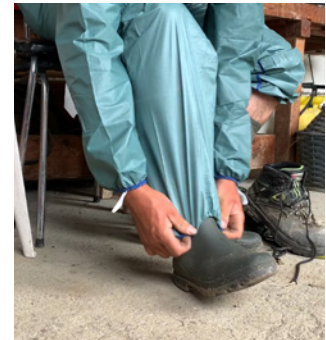
Der Schutzanzug wird über die Stiefel gestülpt. Damit verhindert man, dass PSM in den Stiefel eindringt.