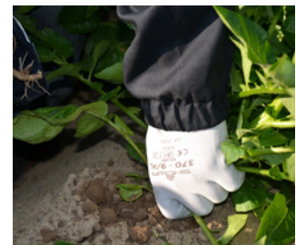
Bei Arbeiten unter trockenen Bedingungen sind Handschuhe des Typs ISO 18889 GR geeignet.