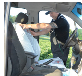
Der Sitz des Fahrzeugs kann durch einen Abfallsack geschützt werden.