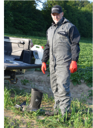
Kleidung gemäss EN ISO 27065, C1/C2 schützt vor Sonne und Kontakt mit Pflanzenschutzmitteln.