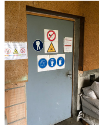
La porta del magazzino è chiusa a chiave e contrassegnata con cartelli di avvertenza.