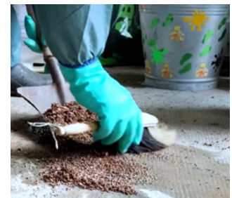
Un assorbente minerale deve essere a disposizione in caso di rovesciamento accidentale.