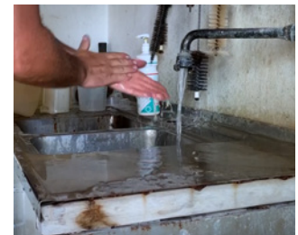
Um sich die Hände richtig zu waschen, benötigen Sie Seife und Einweghandtücher.