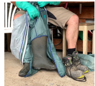
... gleichzeitig vermeiden wir, die Innenseite der Kleidung zu berühren.